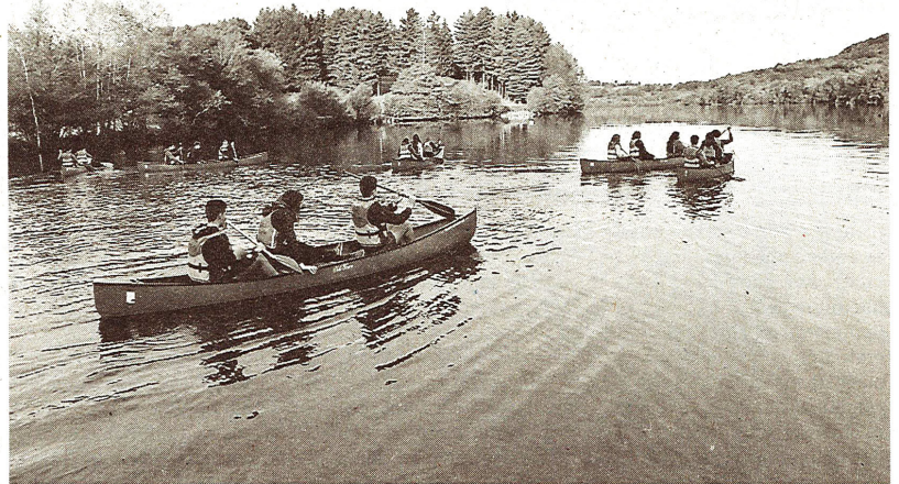
Un groupe d'élèves naviguant sur le lac avec des canoës pour aller faire des prélèvements./Photo Valentin Vié.