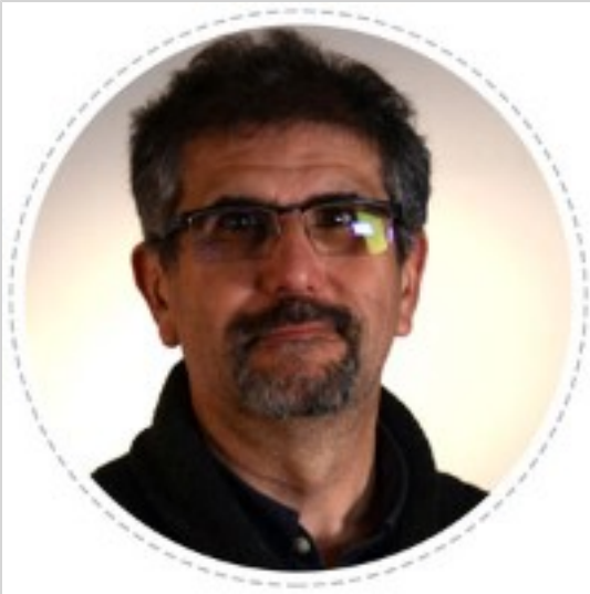
Régis GRIMAUD, Professeur des Universités Mécanismes moléculaires de l'acquisition des métaux chez les bactéries marines